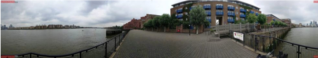
Themse bei Wapping 360 Grad Blick

Nun können wir unsere Fahrt direkt an der Themse fortsetzen. Hinter euch seht ihr die Tower Bridge und vorne kann man schon Londons Finanzzentrum Canary Wharf erkennen.