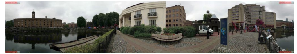
St. Katherine Docks 360 Blick

Radelt nun entspannt an der Promenade entlang, unter der Tower Bridge hindurch und dann links zu den St.Katherine Docks . Hier könnt ihr das Fahrrad ein wenig schieben oder gemütlich am Wasser entlang durch das schicke Wohngebiet fahren.