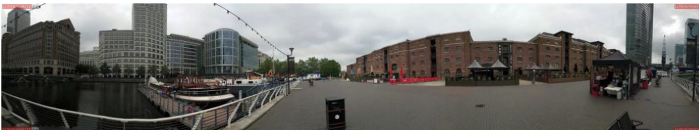
Canary Wharf 360 Grad Blick

Die reine Fahrzeit bis hierhin sollte eigentlich in 25 Minuten machbar sein. Solltet ihr an der ein oder andere Stelle etwas länger verweilen möchten, dann müsst ihr zwischendurch das Rad abstellen und eine Neues mieten. Auf der Strecke befinden sich einige Stationen: Schaut dazu einfach oben auf die Karte.