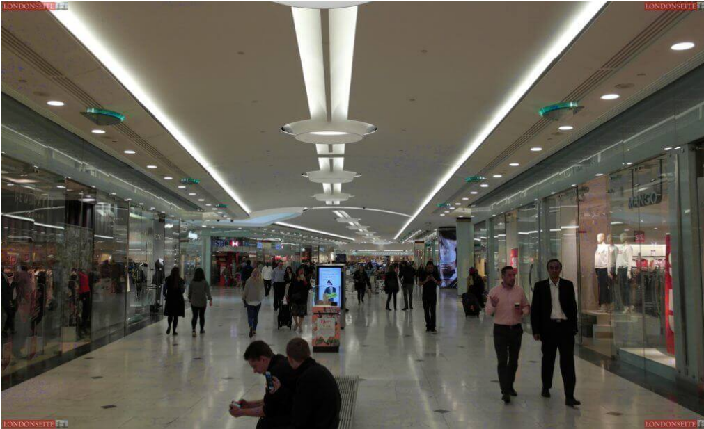
Shoppingcenter unter den Hochhäusern

Nach dem Besuch des Marktes geht es zurück über die Brücke und geradeaus bis zum Canada Place . Auch hier findet ihr im Plateau zahlreiche Einkaufsmöglichkeiten.