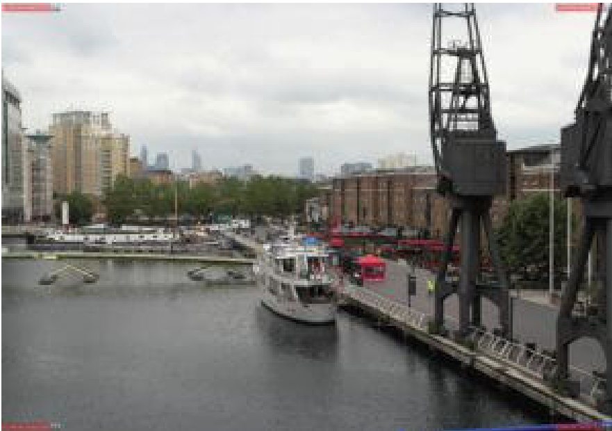
Promenade am Fisherman's Walk

Nach einem Spaziergang über die Promenade geht es über die Hertsmere Road zum Fisherman's Walk . Auf diesem prächtigen Boulevard, gelegen an einem alten Hafenbecken findet ihr auf beiden Seiten zahlreiche exklusive Bars, Pubs und Restaurants.