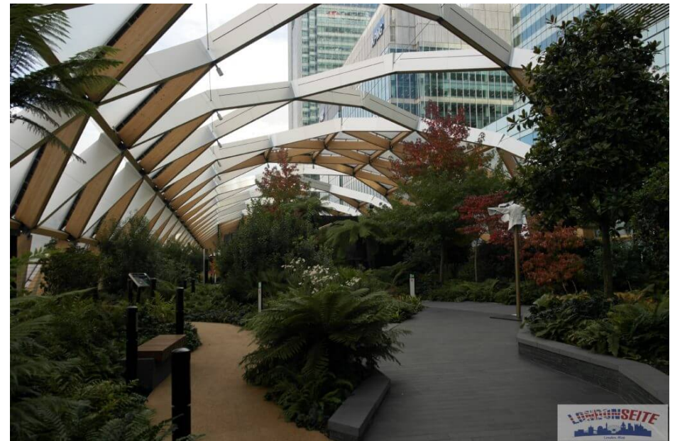
Crossrail Roof Garden

Der Crossrail Place ist das Obergeschoss der neuen Crossrail Station „Canary Wharf“. Ihr findet hier neben weiteren Geschäften und den üblichen Ess- und Trinkgelegenheiten einen wunderschönen Garten. Der Crossrail Roof Garden ist komplett überdacht und ist die ideale Gelegenheit für eine kleine Pause.