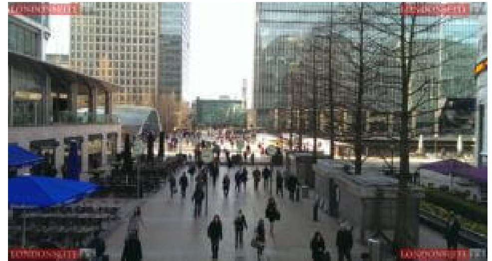
Canary Wharf Station am Morgen

Wir starten unseren Spaziergang U-Bahn Haltestelle Canary Wharf: gleich hier wird einem die Dimension dieser Gegend bewusst. Die 60 m hohe, futuristische Bahnhofshalle von Stararchitekt Norman Foster gibt mit ihren Glasüberdachten Rolltreppen einen ersten Eindruck, was euch in Canary Wharf erwartet.