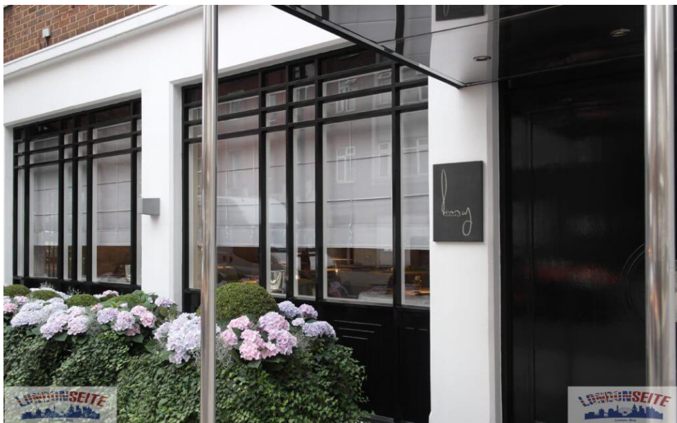
Gordon Ramsay Restaurant