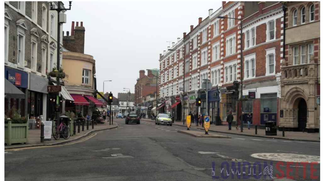
Wimbledon High Street

Wer möchte kann zuvor noch ein wenig in den Geschäften in der Nähe des Bahnhofs bummeln.